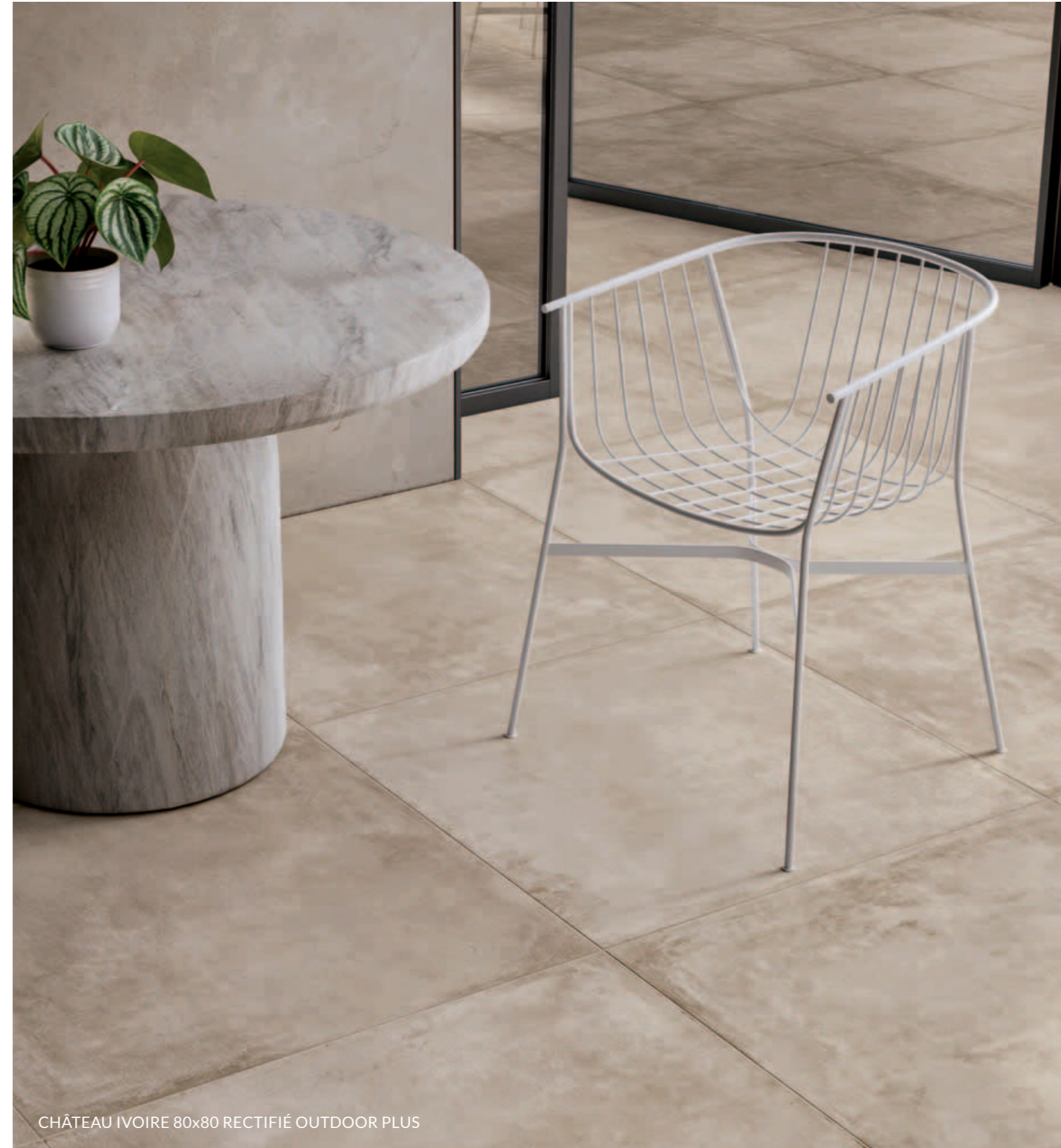
CHÂTEAU IVOIRE 80x80 RECTIFIÉ OUTDOOR PLUS